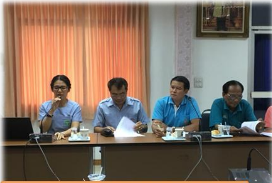
1 อาหารปลอดภัย