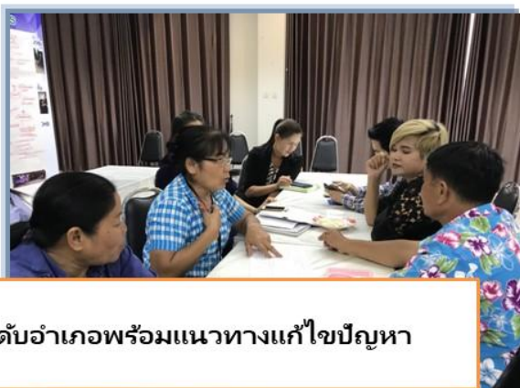
จัดลำดับความสำคัญของปัญหาระดับอำเภอพร้อมแนวทางแก้ไขปัญหา