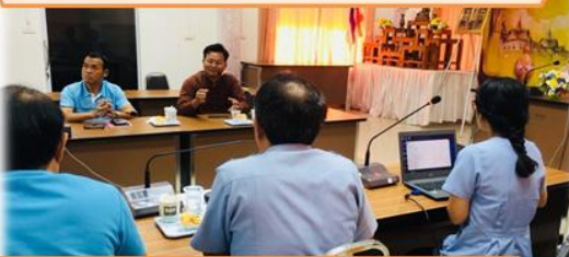
คัดเลือกปัญหาระดับพื้นที่/ตำบล ถาวรวัฒนา