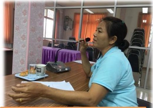
2 ลดเสี่ยงลดพุงลดอ้วน