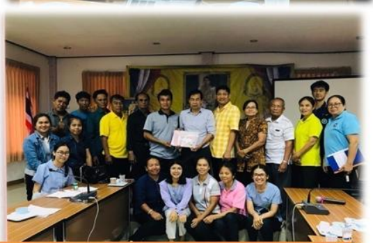
จัดทำแผนแก้ไขปัญหาระดับพื้นที่/ตำบล ถาวรวัฒนา