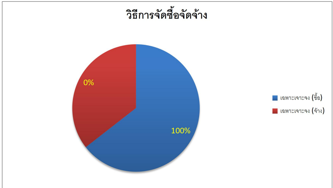
แผนภูมิที่ ๒ แสดงจำนวนของโครงการที่ดำเนินการจัดซื้อจัดจ้างปีงบประมาณ ๒๕๖๔ โดยวิธีเฉพาะเจาะจง